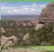
Sant Llorenç del Munt i l'Obac