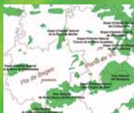
Els espais naturals protegits del Bages i Osona.

En uns casos aquesta protecció és força estricta, com passa a les reserves naturals, mentre que en d'altres, com és el cas dels parcs naturals, es permet dur-hi a terme diferents tipus d'activitats si no afecten de manera negativa els seus valors naturals.