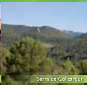
Serra de Collcardús