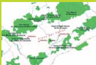
Mapa del Vallès amb indicació dels onze espais naturals protegits; d'aquest, només dos són a la plana.

Sovint, però, els espais naturals protegits es concentren a les zones forestals de muntanya, mentre que als espais agroforestals i als espais fluvials de la plana se'ls atorga un baix grau de protecció , precisament on les pressions urbanístiques i de les infraestructures són més intenses.