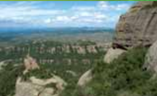
Sant Llorenç del Munt