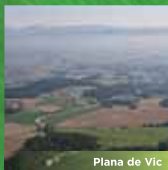
Plana de Vic

A bona part de la regió metropolitana de Barcelona el paisatge es caracteritza per l'existència d'extenses planes agrícoles —on també s'han desenvolupat els principals nuclis urbans— rodejades d'alts relleus forestals i travessades per nombrosos rius i rieres .