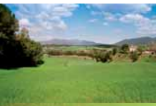
Farratges al Vallès Oriental