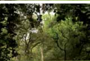
Serra de Collserola