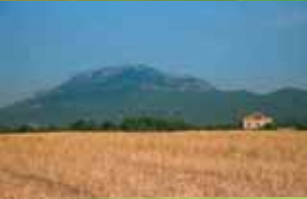
Cereals al Vallès Occidental