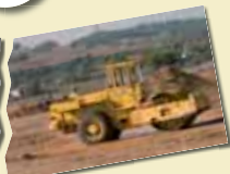
El teu paisatge Sabadell, Sant Pau de Riursec (2009)