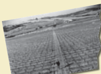
El paisatge dels teus pares Sabadell, Sant Pau de Riursec (1965)