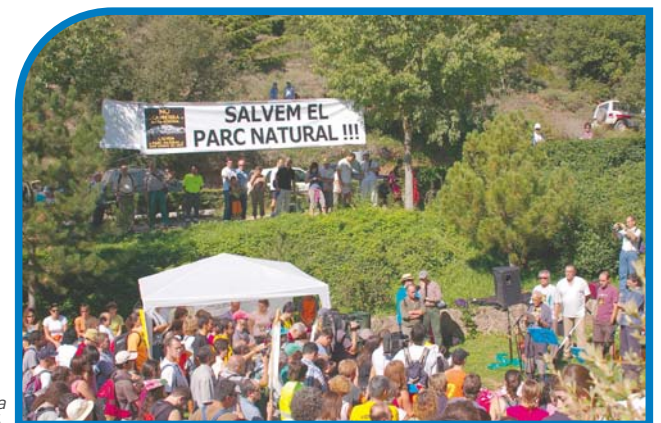
Concentració al coll d'Estenalles contra la pista de la Coma d'en Vila a Mata-rodonà, octubre del 2006.