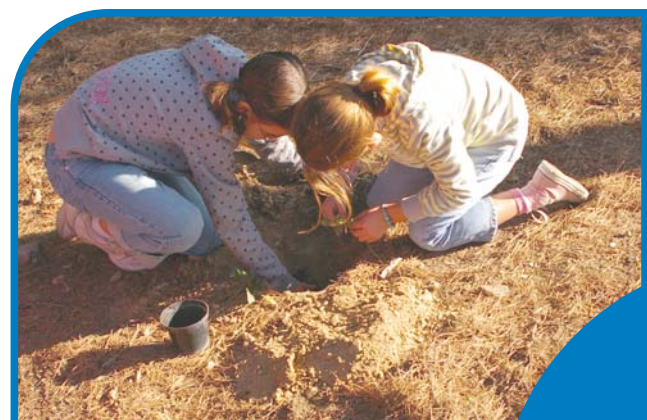
Plantació d'alzines al bosc de la Salut.