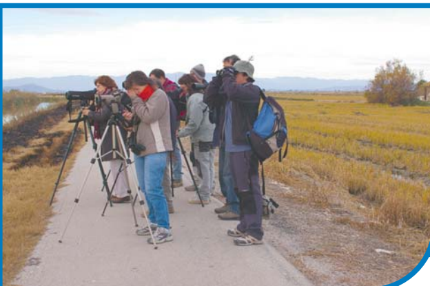
Sortida ornitològica al Delta de l'Ebre.