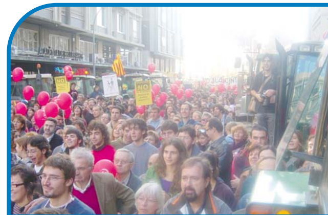
Manifestació contra el Quart Cinturó a Sabadell, desembre del 2006.