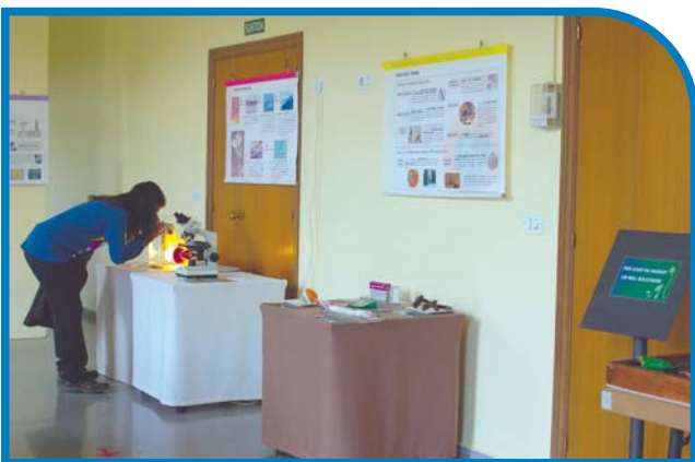
Mostra de bolets a Sabadell, tardor del 2010.