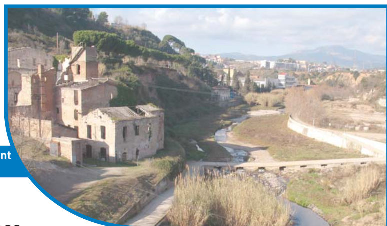
El molí d'en Torrella, amb orígens al s. X. Un dels molins emblemàtics del Ripoll, a l'espera d'una urgent rehabilitació.

S egles després, aquests molins es van aprofitar per a diferents tipus d'activitats manufactureres i passaren a ser molins drapers, paperers i polvorers, fargues, etc. A partir del segle XIX, els edificis dels molins van ser transformats en les grans fàbriques tèxtils que han arribat, d'una manera o altra, fins als nostres dies.