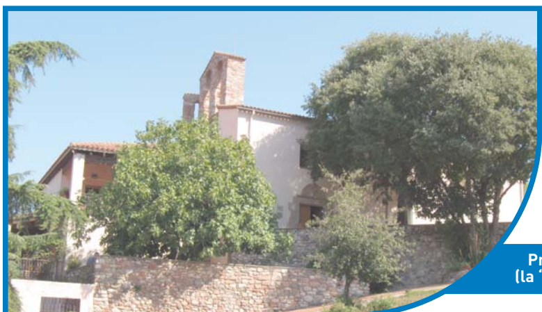
Pràcticament a tocar del Ripoll, Sant Vicenç de Jonqueres, església de l'antic nucli rural del mateix nom (la "vila loncharias") documentat des del segle X.

D es del segle X es documenta que les amples riberes del Ripoll van ser ocupades per a usos agrícoles, i s'hi construïren sèquies i rescloses lligades al funcionament de molins i per millorar els rendiments de l'agricultura.