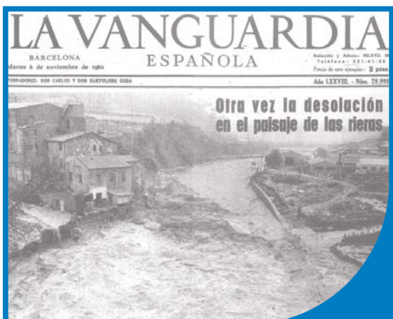
Portada de La Vanguardia del 6 de novembre de 1962, setmanes després de la gran riuada del 25 de setembre. A la fotografia s'aprecia la dimensió i l'impacte de les grans riuades del Ripoll a l'alçada del molí d'en Torrella.

A banda, per evitar danys com els de la riuada del 1962, el Ripoll i bona part de la conca del Besòs van ser canalitzats amb murs de formigó. D'aquesta manera —contaminat, amb la vegetació pròpia d'un ambient degradat i amb la dinàmica natural del riu completament alterada per murs de formigó i rescloses—ens va arribar el Ripoll fins pràcticament al segle XXI.