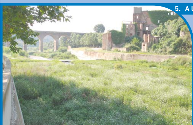
5. A l'altura del pont de la Salut