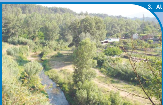
3. Al Rieral (entrada al terme municipal de Sabadell)