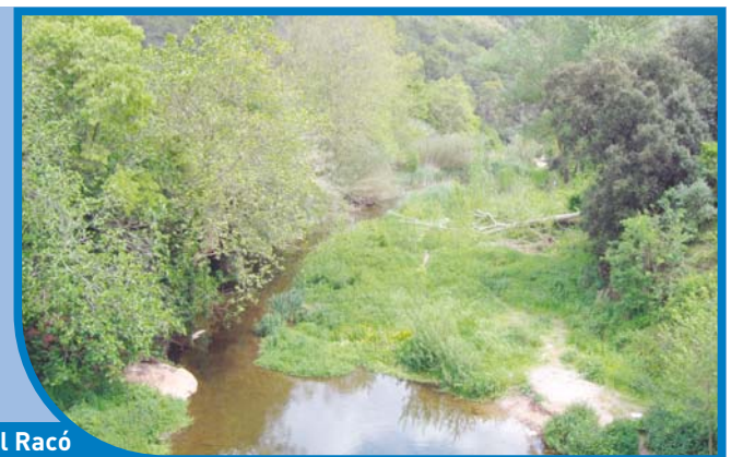
2. A l'entrada de Sant Feliu del Racó