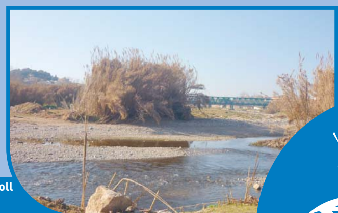
8. A la confluència del Ripoll amb el Besòs (Montcada i Reixac)

Diverses imatges del riu Ripoll. Les dues primeres imatges ens mostren un Ripoll amb una vegetació fluvial ben conservada i un bon estat ecològic. A partir de Castellar del Vallès, i sobretot al seu pas per Sabadell, l'estat ecològic del riu Ripoll va empitjorant progressivament (fotografies 3, 4, 5, 6, 7 i 8).