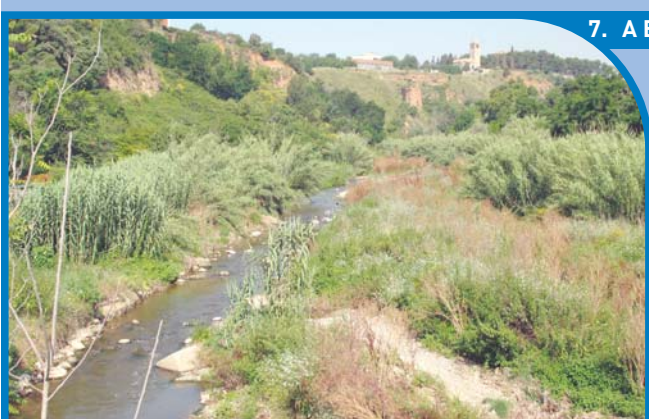
7. A Barberà del Vallès