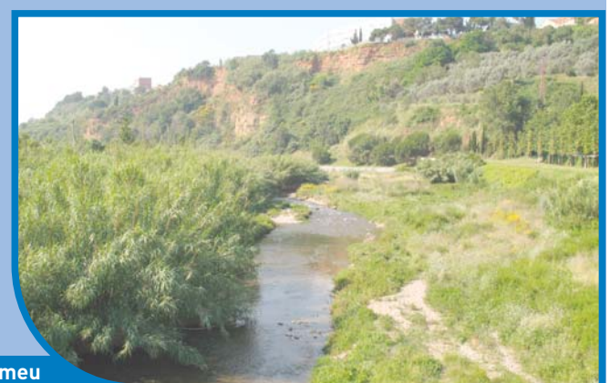
6. Des de la passarel·la de Torre-romeu